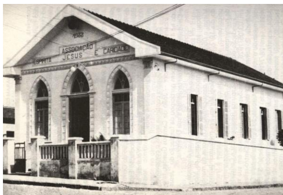
Associação Espírita Jesus e caridade, de Mogi Mirim, fundada em 1933.

Devotados Benfeitores Espirituais estão cooperando em nosso favor, e devemos confiar na proteção de Jesus, hoje e sempre.”“.